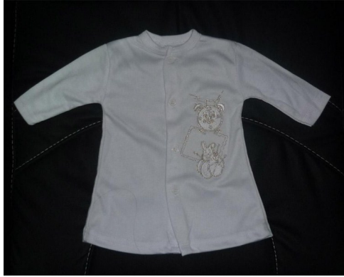
كنت احلم بأن البس ابنتي هذا الفستان لكن آل خليفه سرقوا حلمي

جميع التقارير الطبية كانت سليمة لما بعد ٢٦ اسبوع من الحمل، لم تظهر صور السونار وجود أعراض تهدد حياة الجنين. تحدثت معها شخصيا و اخذت تفاصيل الولادة، و ما يجدر قوله هنا أن حتى ولادتها بالجنينة المتوفاة لم تكن طبيعية، بل تعرضت لخطر كبير في الولادة لولا لطف الله، لم يكن الخطر خطأ طبي قدوما كان نتيجة لمضاعفات الغازات، كما ذكرت سابقا في تغريدات أخطار الغاز بأنه يؤثر على رحم المرأة و يؤدي لتشوهات جنينية، وهذا تماما ما حدث